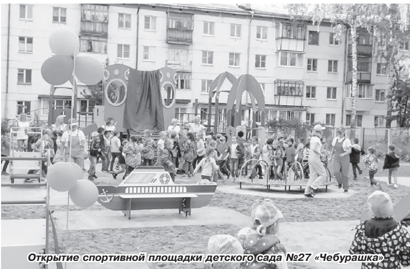
Открытие спортивной площадки детского сада №27 «Чебурашка»

Сегодня в Пермском крае и Чайковском городском округе, как и в стране в целом, всё больше внимания уделяется реализации гражданских инициатив. Наиболее заметно это проявляется во всё более широком внедрении инициативного бюджетирования – непосредственного участия населения в осуществлении местного самоуправления путём выдвижения инициатив по расходованию определённой части бюджетных средств.