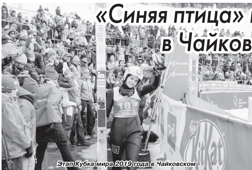
Этап Кубка мира 2019 года в Чайковском